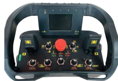
Radio console by AUTECH Console radio by AUTECH